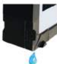
Drainage de feu