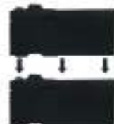
Conditionnement exclusif Plus aucun déchet de recyclage